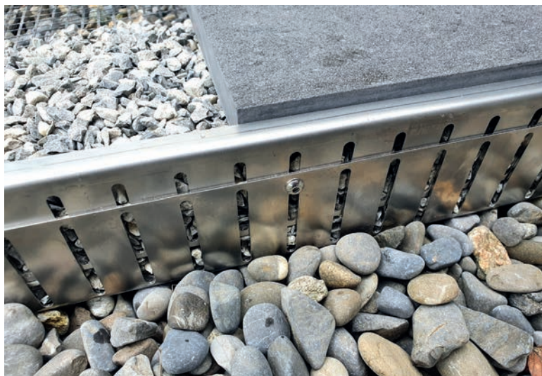
Le lit de gravillon est bien assuré en cas de gradation.