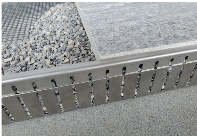
Les dalles lestent la languette et le filet. Le profil est ainsi fixé.

variafix se compose d'un angle de base et d'un élément de mise en place vissé et réglable en hauteur.