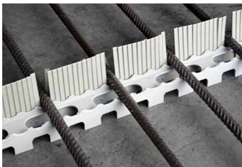
Beim Kombiprodukt ferrofix kamm ergänzt ein Kamm aus PE das herkömmliche ferrofix.