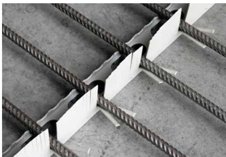
Spaltlos geschnitten, lässt der Kamm keine Schlacke durch.

ferrofix wird zu 100% aus recyciertem Material hergestellt.