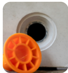
oroSet Konus 22/15 Standard

Der oroSet Konus definiert die Bindstelle exakt und schafft die Voraussetzung für einen sauberen, bündigen Abschluss. Er sorgt für eine scharfkantige Ausbildung und ist die Basis für den Einsatz der oroSet Abdeckungen.