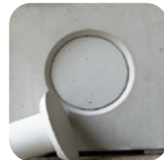
Sichtbetonkegel 22/05 rückversetzt