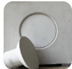
Sichtbetonkegel 22/10 fast bündig

So entsteht ein präzises und stimmiges Gesamtbild.