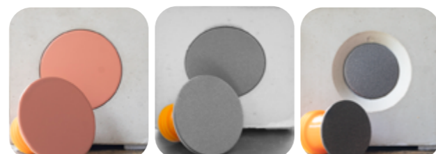
Grundscheibe = Chromstahl