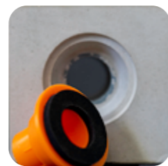
oroSet Konus 22/15D Mit 4 mm Dichtring für hohe Schalungsdrücke oder Schalung mit grossem Radius.