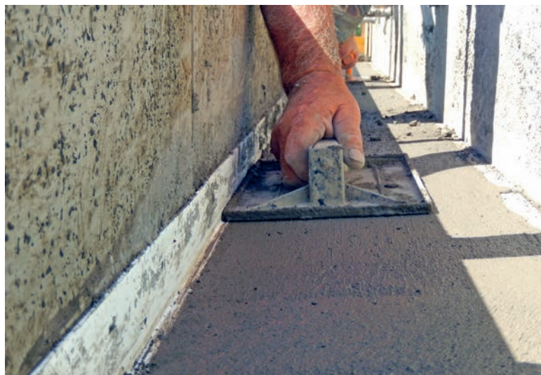
Das mauerkroneprofil dient als Lehre beim Abziehen der Mauerkrone.

Das mauerkroneprofil nageln Sie an der langen Seite auf die Schalung. Der kurze Schenkel gibt dabei die Oberkante der künftigen Mauer an. Nun betonieren Sie wie gewohnt und ziehen am Schluss die Mauerkrone ab. Hier dient nun das mauerkroneprofil als zuverlässige Abziehkante für eine horizontale saubere Mauerkrone.