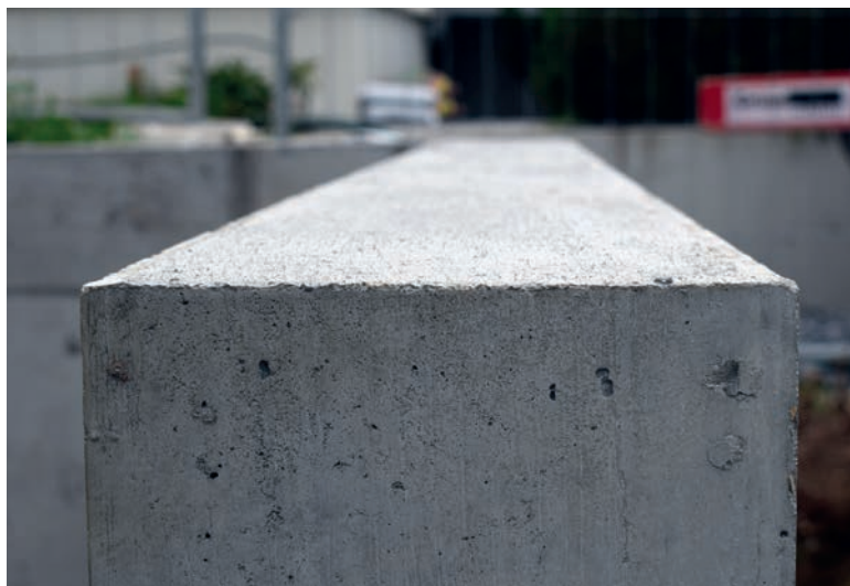
scharfkantige und ebene Mauerkrone nach dem Ausschalen.