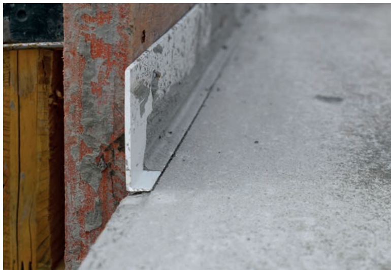
Das Winkelprofil ist an der Längsseite an die Schalung genagelt.